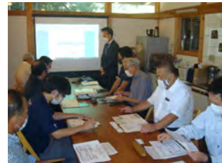
環境省・令和3年度 地域再エネ中核人材育成 支援事業・ワークショップ (掛川市)