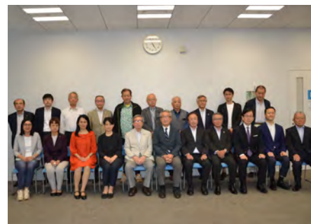
TREIN 総会 (2022.6.10)