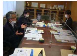
環境省・令和3年度 地域再エネ中核人材育成 支援事業・現地指導会 (長岡市)