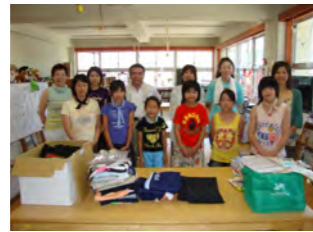
復興支援活動 宮城県石巻市 (2011.7.10)