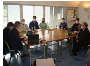
環境省・令和3年度 地域再エネ中核人材育成 支援事業・ワークショップ (掛川市)