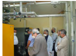
環境省・令和3年度 地域再エネ中核人材育成 支援事業・現地指導会 (矢板市)