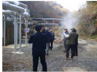
再エネ視察調査 新潟県十日町市 (2020.11.13)