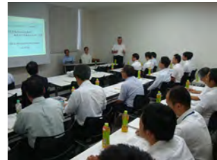
金融機関向けセミナー 掛川市・掛川信用金庫 (2017.9.6)