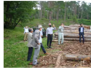
再エネ視察調査 長野県茅野市 (2021.6.18)