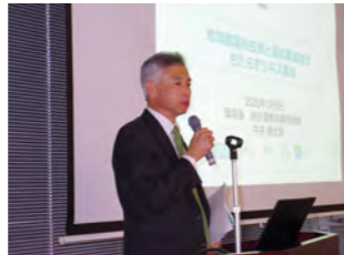
基調講演 環境省・中井事務次官 (2020.1.8)