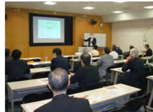
市民向け再エネセミナー 熊本県熊本市 (2021.10.23)