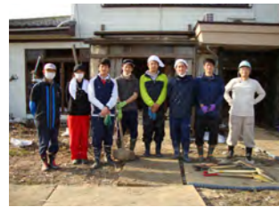
復興支援活動 宮城県石巻市 (2011.5.4)